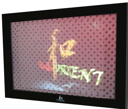
ハットタッチ 3Dインタラクティブ・ADパネル