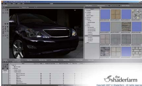
自動車モデルへのシェーダ適用例